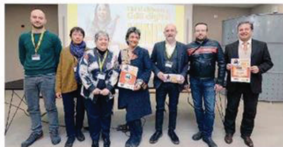
La premiazione. I vincitori nella sede del GdB